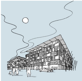
Bykarréer ved Søren Frichsvej Skitser: CEBRA

Mange kender de grønne arealer mellem Søren Frichs Vej og Aarhus Å som den tidligere NorthSide-plads, men nu præsenterer virksomhederne BRICKS og Raundahl & Moesby planerne for en helt ny bydel – eller rettere flere nye bykvarterer – i Ådalen.