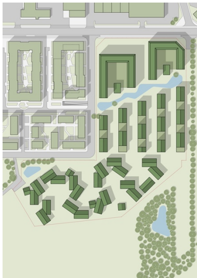
Den nye bydel med tre forskellige kvarterer. De høje karréer ligger ud til Søren Frichs Vej. Skitse: CEBRA

Arkitekturen vil være inspireret af eksisterende greb fra Aarhus men med et nutidigt twist. Mikkel Frost henviser blandt andet til et par af tegnestuens seneste projekter i Aarhus som pejlemærker for den nye bydel i Ådalen: